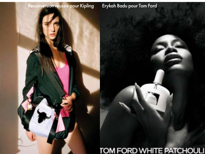
TOM FORD WHITE PATCHOULI

Reconversion réussie pour Kipling Erykah Badu pour Tom Ford